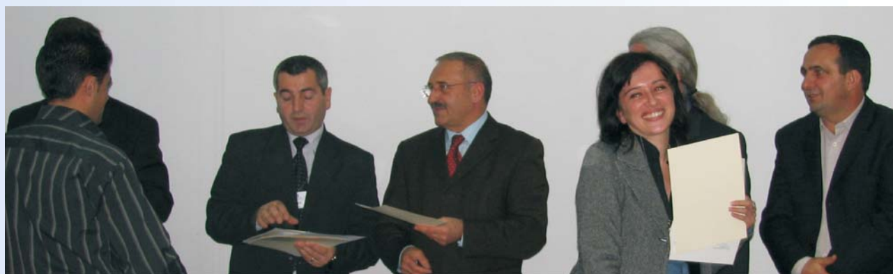
Pripremični program uvodi sveže kadrove u pravnu i sudsku struku, obezbeđujući dobro kvalifikovane i obučene buduće sudije, advokate i tužioce

Preko svoje podrške programu pripremičkog staža ABA ROLI nastoji da da svoj doprinos da se pravna i sudijska struka osveže novim, kvalifikovanim i dobro obučanim budućim sudijama, advokatima i tužiocima. Program je ostvario izuzetan uspeh, kako smo saznali iz razgovora sa diplomcima koji su učestvovali u ovom programu, budući da su mnogi od njih angažovani na unapređenju vladavine prava na Kosovu.