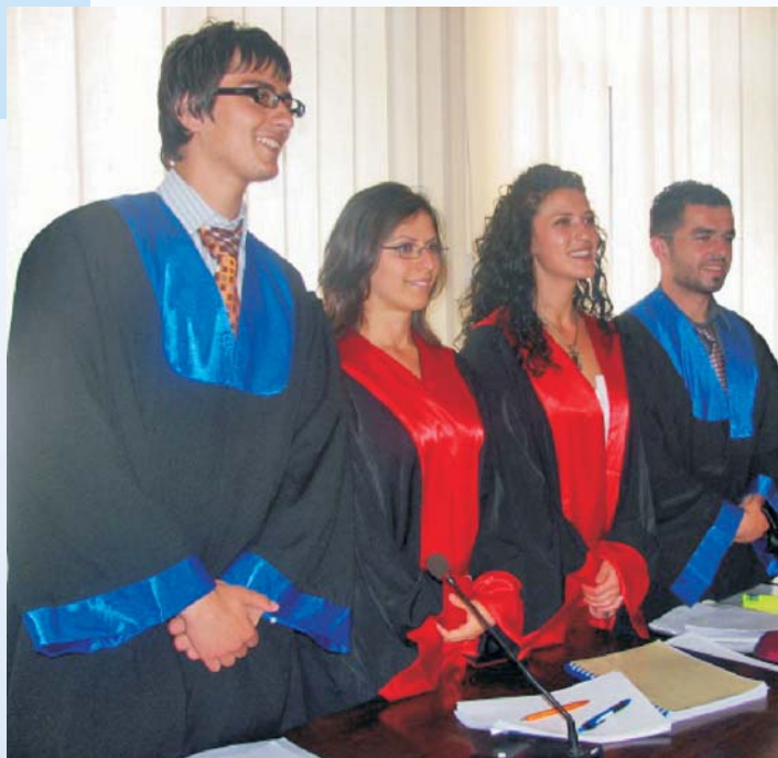
Reforma pravnog obrazovanja je oblast koja ima primarni značaj za ABA ROLI na Kosovu

ABA je ustanovila svoj javni projekat: Inicijativu za vladavinu prava (ABA ROLI) u 2007. godini, sa uverenjem da je unapređenje vladavine prava najdelotvorniji dugoročni protivlek za najteže probleme sa kojima se svet danas suočava, uključujući tu siromaštvo, sukobe, endemsku korupciju i nepoštovanje ljudskih prava. Danas, ABA ROLI (ranije CEELI), sprovodi svoje programe pravnih reformi u više od 40 zemalja u Africi, Aziji, Evropi i Evroaziji, Latinskoj Americi i Karibima, i Srednjem Istoku i Severnoj Africi.