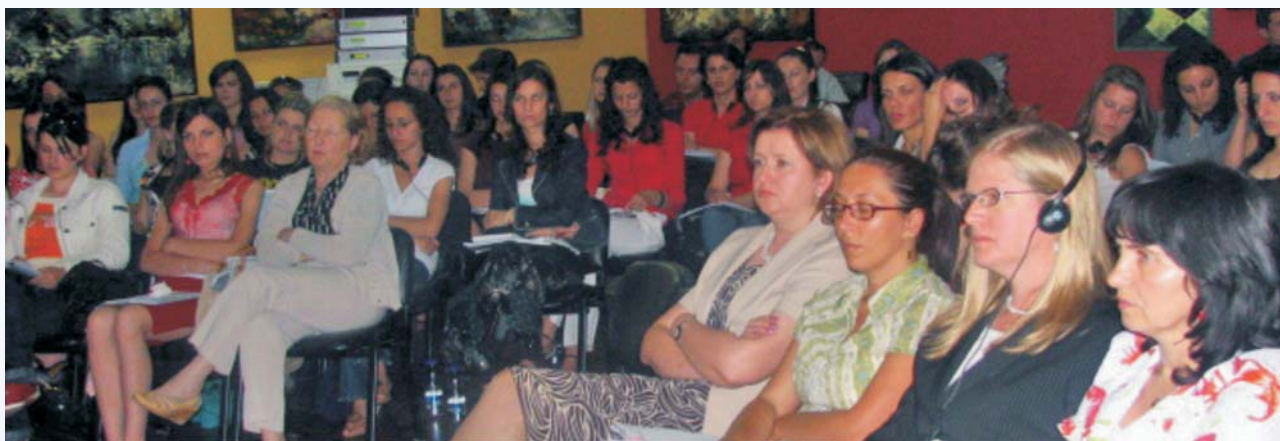
Cilj ABA ROLI je da pomogne ženama i manjinama na Kosovu da ostvare jednakost u pravnoj struci

U tom smislu, ABA ROLI je organizovala Konferenciju pod nazivom "Žene u pravnoj struci na Kosovu." Na ovoj Konferenciji, žene advokati i pravni stručnjaci na Kosovu razmatrali su glavne smetnje sa kojima se suočavaju mlade diplomirane pravnice prilikom ulaska u pravnu struku.