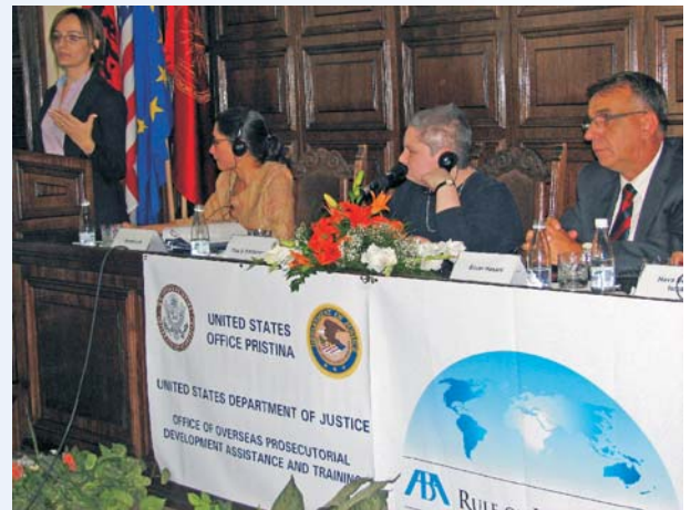
Memorandum o razumevanju, potpisan između Američke ambasade u Prištini, ABA ROLI, i Univerziteta u Prištini o uvođenju novih kurseva

Predmet Pravna metodologija prvi put je uveden 2006 godine i isplaniran je da studente opskrbi osnovnim