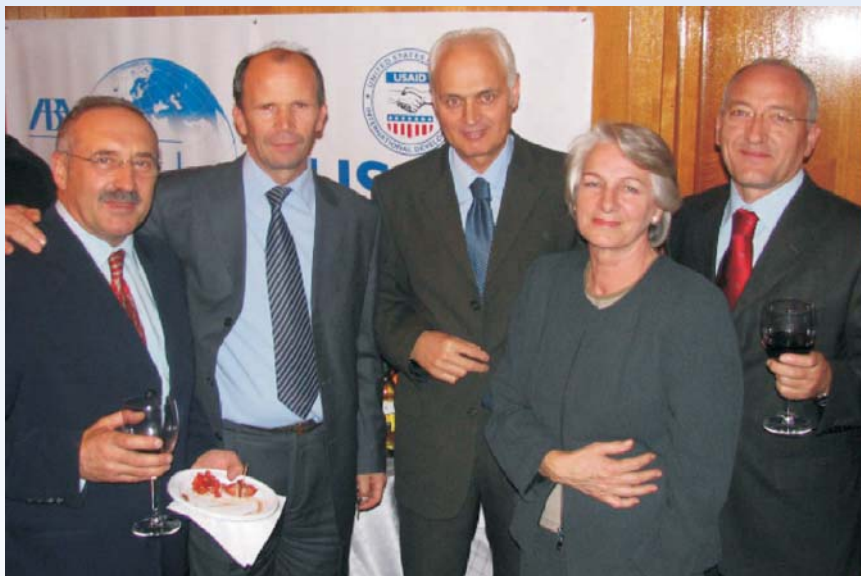
Podrška i saradnja lokalnih strukovnih organizacija bila je veliki doprinos u uspešnom 10-godišnjem radu ABA na Kosovu

Od samog početka svog programa, primarni cilj ABA ROLI bio je ustanovljenje osnovnih pravnih institucija u post-konfliktnom okruženju, unapređenje samoodržive obuke za sudije (naročito vezano za nezavisnost pravosuđa), advokate i tužioce, i za projekat dokumentacije ratnih zločina.