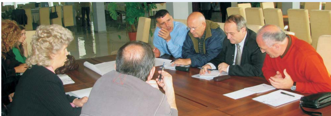
Članovi AKK rade na izradi njihovog 5-godišnjeg strateškog plana

AKK radi na jačanju svog organizacionog razvoja koji bi joj omogućio da uspešno prođe kroz period intenzivnog rasta i usmerenog razvoja.