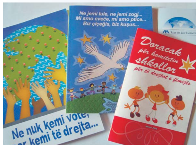
Knjige o građanskim pravima za osnovnu i srednju školu koje su objavili ABA i Kosovski Edukacioni Centar

ABA ROLI i KEC takođe su organizovali da učenici posete okružne, opštinske i sudove za maloletnike. Tokom ovih poseta, učenici su imali prilike da se upoznaju sa lokalnim sudijama i da im postave pitanja o njihovoj struci i o pravnom sistemu. Posete sudovima organizovane su u svim regionima Kosova i u njima je učestvovalo oko 200 učenika osnovnih i srednjih škola.