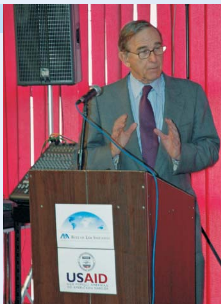
Sudija Saveznog Okružnog Suda, John M. Walker, Jr., prezentuje nekih od faktora koji doprinose korupciji na Kosovu

Konferencija je najpre bila usmerena na uzroke korupcije. Sudija John M. Walker, Jr., viši sudija u Apelacionom Sudu SAD za drugi Okrug govorio je o broju faktora koji utiču na korupciju na Kosovu. On je istakao "nedostatak transparentnosti, male plate (najmanje u regionu), nedostatak dobro obučanih sudija, i nedostatak jasnih pravila i linija odgovornosti." Takođe je zapazio da je korupcija globalni problem i da pravosuđe u svakoj zemlji na svetu treba budno da je prati kako bi je iskorenila.