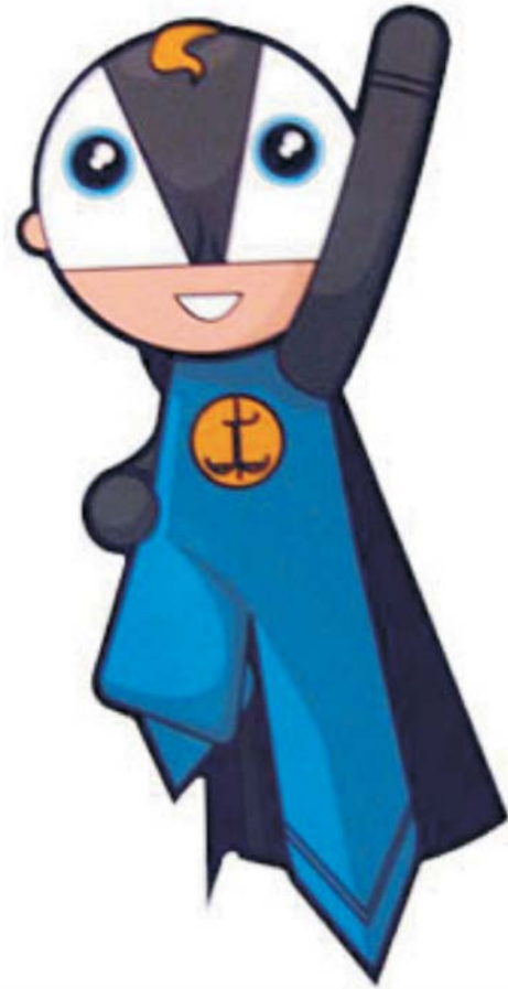
Dete Pravde, Prvi kosovski animirani superheroj

Nezavisna anketa koja je sprovedena da se oceni ova kampanja pokazala je da su skoro svi ispitanici iz svih regiona Kosova smatrali da su ovi crtani filmovi odlični. Preko 50% ispitanika izjavili su da su preko filma saznali da mogu da podnesu pritužbu zbog neposlovnog ponašanja advokata ili sudije.