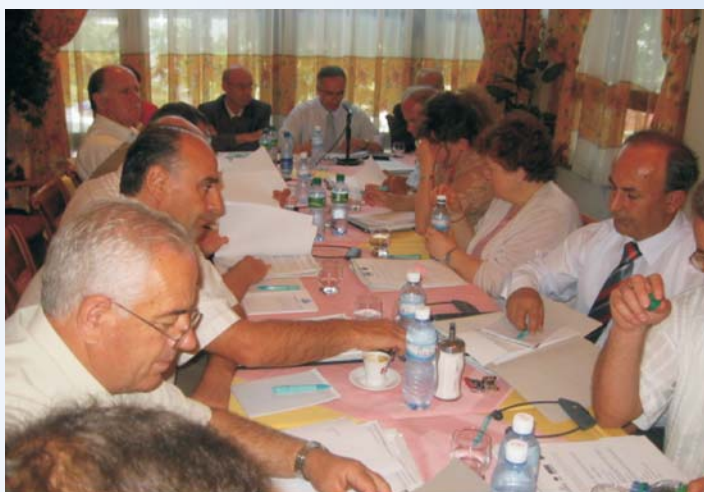
Predsednik USK govori na Konferenciji o razvoju transparentnog pravosudnog sistema

Osim toga, USK je uspostavilo uspešne odnose sa drugim asocijacijama sudija u Centralnoj Evropi da bi nešto više saznalo o najboljim praksama u vezi sa stvarima kao što su finansiranje, aktivnosti članstva, komunikacije sa članstvom, publikacije, etika, advokatura, lobiranje, i plate sudija.