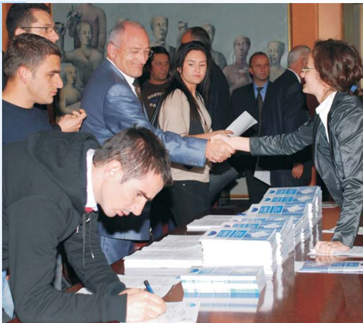
Svečano objavljivanje ABA ROLI-nog Indeksa reforme pravnog obrazovanja

ABA ROLI se nada da će ove publikacije i njihove ocene pomoći da se pažnja i drugih donatora, međunarodnih organizacija i kosovskih institucija usmeri na reformu pravne struke na Kosovu.