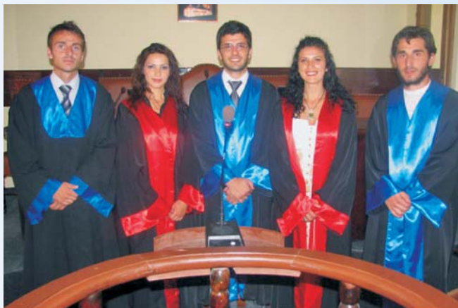
Kosovski studenti prava takmiče se u nekoliko insceniranih suđenja

“Radeći na stvarnim predmetima uz budni nadzor, studenti će naučiti da vrše pravnu analizu i tumačenje, razviju veštine pisanja pravnih tekstova, i kako da ispituju klijente”, istakao je značaj pravne klinike Hava Ismajli, dekan Pravnog Fakulteta.