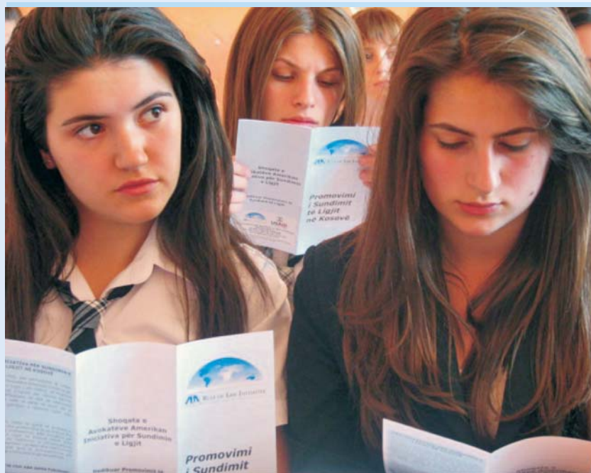
Učenici srednje škole na Praco za Mlade