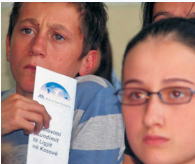
Dete Pravde obraća se mladoj generaciji, noseći poruke o ravnopravnosti polova, vladavini prava i ljudskim pravima