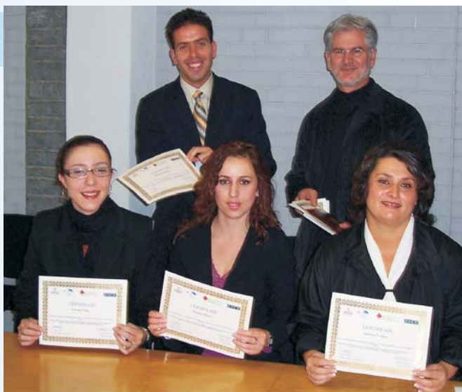
Diplomirani pravnici na Kosovu koji su završili jednogodišnji pripremični program

Po kosovskom zakonu, diplomirani pravnik dužan je da završi pripremični staž u trajanju od godinu dana u kancelariji nekog advokata ili sudije da bi mogao da stekne pravo da polaže pravosudni ispit, koji diplomirani pravnici moraju da polože da bi mogli da se bave pravnom strukom.