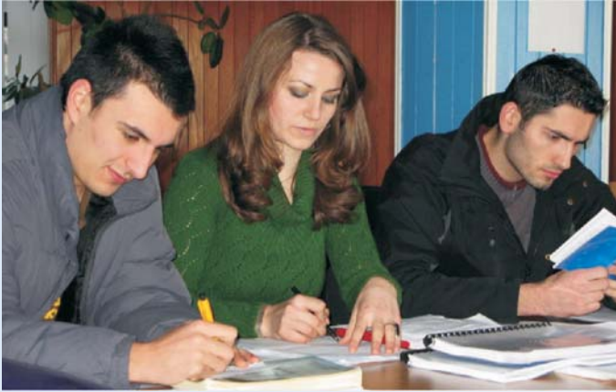
Dobro obučeni diplomirani pravnici neophodni su za razvoj nezavisnog, efikasnog, delotvornog i odgovornog pravosudnog sistema

pravnim veštinama kao što su kritičko razmišljanje i analiza, pravno istraživanje i pisanje, praktično zastupanje i advokatske veštine, i profesionalna etika i odgovornost. U 2008 godini ABA ROLI je uvela još jedan novi predmet, Pravnu Etiku i Profesionalnu Odgovornost i objavila je Priručnik o Pravnoj Etici, koji služi kao osnovna literatura za ovaj predmet. Takode u 2008, seminar za Pravne Analize & Pisanje je uveden da pomaze studentima da poboljšaju pisane sposobnosti.