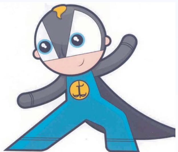
Dete Pravde povećava razumevanje prava kod omladine ove zemlje