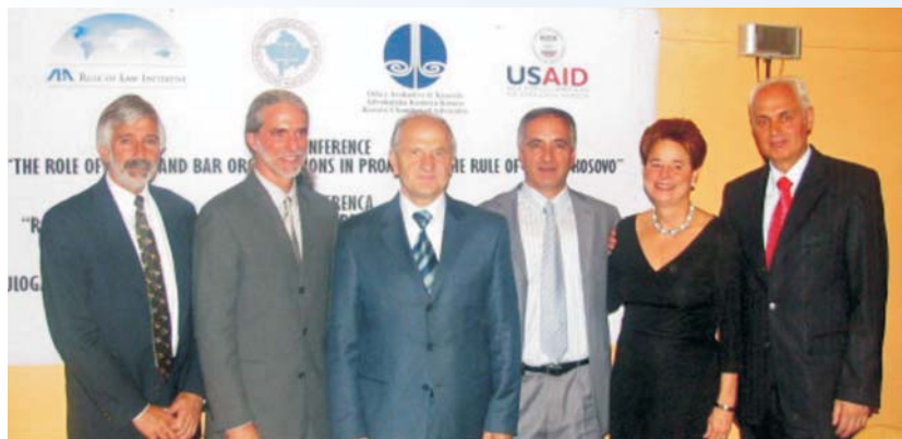
Predsednik Kosova, Fatmir Sejdiu, daje uvodnu reč u raspravi o Ulozi Udruženja sudija i Advokatske komore na unapređenju vladavine prava

pravosuđe, proces izbora sudija, uticaj lokalnih organizacija i asocijacija na unapređenje sudske nezavisnosti i kompetentnosti, i potreba da se poveća polna i etnička raznolikost u sudskoj struci.